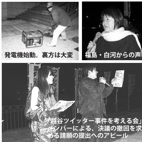
発電機始動。裏方は大変