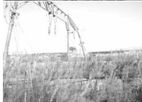
富岡駅構内は雑草に覆われ、架線を支える鉄製の柱は壊れたまま。そして横転したまま放置されている錆ついた車。まるで「見えるはずのない」放射能が「見える」ようだった

二〇一五年春に帰町が予定されている楢葉町の、小高い丘から町を一望した。かつての稲田は汚染土のコンテナバッグで占められていた。コンテナバッグの耐久性を補うためか緑のシートがかけられている。点在するカーテンの閉まった住宅の脇にも、一様に汚染土の袋が積まれていた。