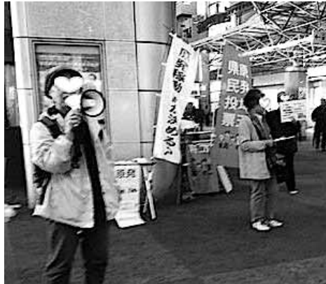
南越谷駅前での呼びかけ

●日時：2015年3月28日(土) 18:30開場 19:00開演 ●場所：新宿区立新宿文化センター ●主催：さようなら原発 1000万人アクション