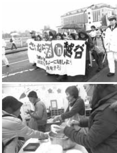
200人のパレードが平和橋を渡る。雨の中だったが、元気に貫徹（上）。パレードのゴール「生活館」では、温かくおいしい豚汁が待っていた (2014.3.1)

わたしたちは沖繩での『建白書』を中心にした統一の力を知っています。県知事選・衆院選4小選挙区での勝利は、私たちに大きな希望と勇気をあたえてくれました。私たちは平和憲法を守りいかそう、原発をなく