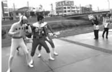
昨年の大集会。絶対原子力戦隊イシシンジャーのアトラクション。大うけだった